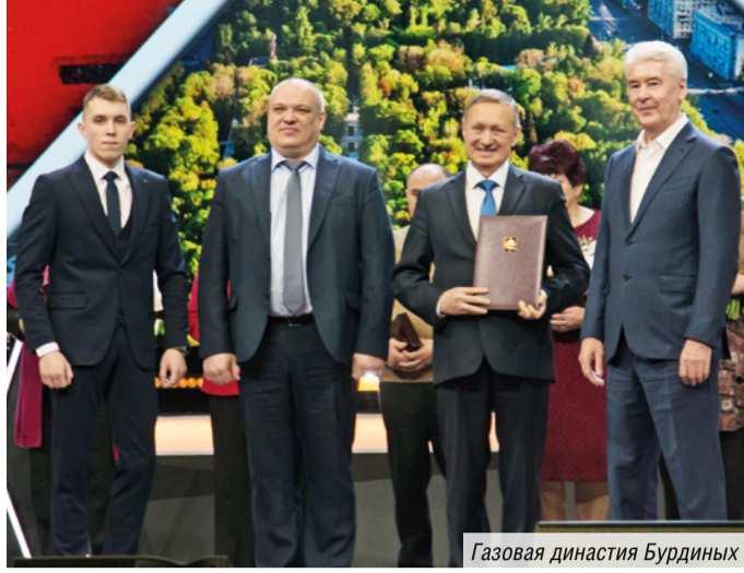
Газовая династия Бурдиных