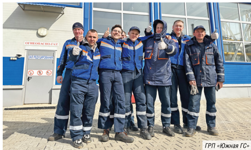
ГРП «Южная ГС»

Чистота — та же красота, говорят в народе. После генеральной уборки, усилий миллионов пар рук Москва, как водится, встретит Первомай и День Победы во всем своем великолепии. Светлая. Цветущая. Обворожительная. В такой город нельзя не влюбиться.