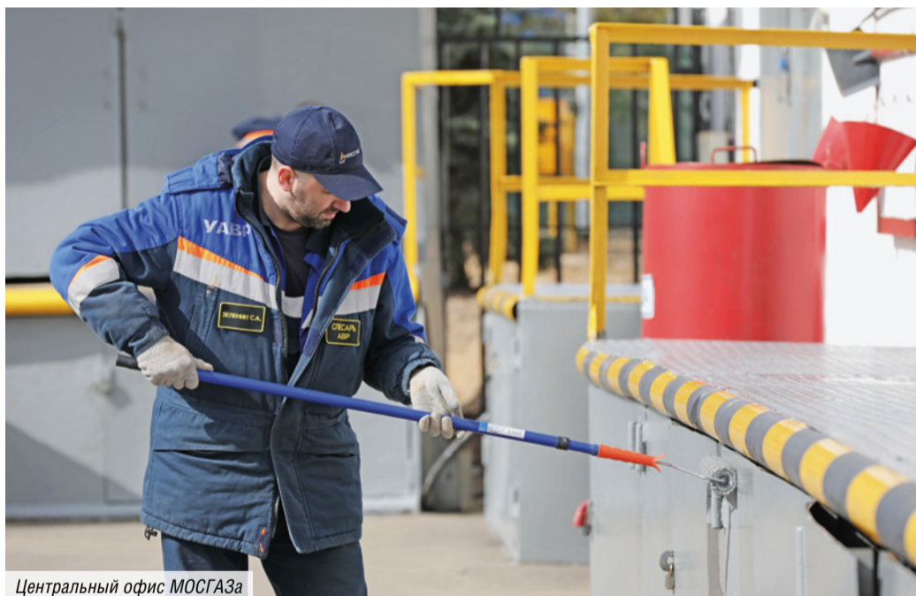
Центральный офис МОСГАЗа