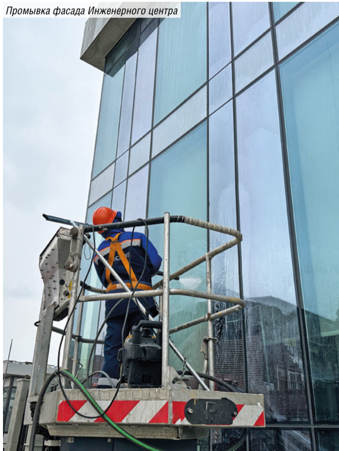
Промывка фасада Инженерного центра