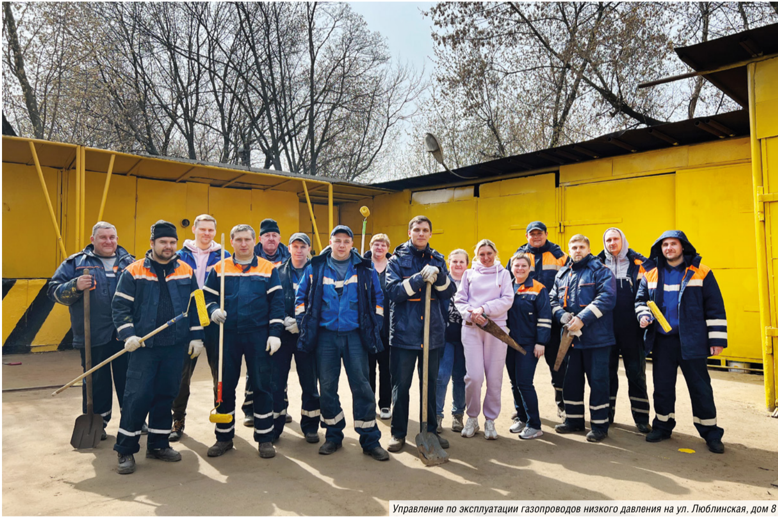
Управление по эксплуатации газопроводов низкого давления на ул. Люблинская, дом 8

КАК МОСГАЗ ПРИНЯЛ УЧАСТИЕ В ГЕНЕРАЛЬНОЙ УБОРКЕ СТОЛИЦЫ