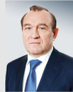
Заместитель Мэра Москвы Петр Бирюков

«В рамках месячника по благоустройству 15 апреля провели общегородской субботник, в котором приняло участие рекордное число жителей столицы — около 1,7 миллиона человек. Это работники комплекса городского хозяйства, сотрудники предприятий и организаций, школьники и студенты. Совместно провели работы по уборке города после зимы, очистили дворовые территории, парки и скверы, высадили деревья».