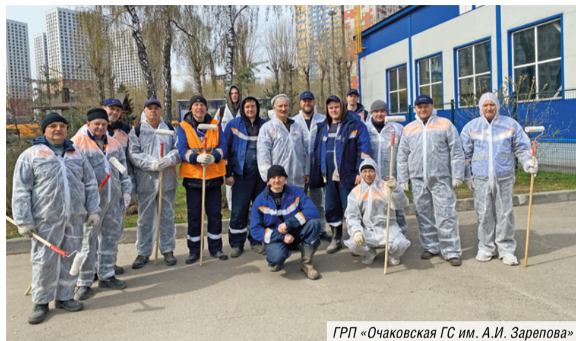
ГРП «Очаковская ГС им. А.И. Зарепова»